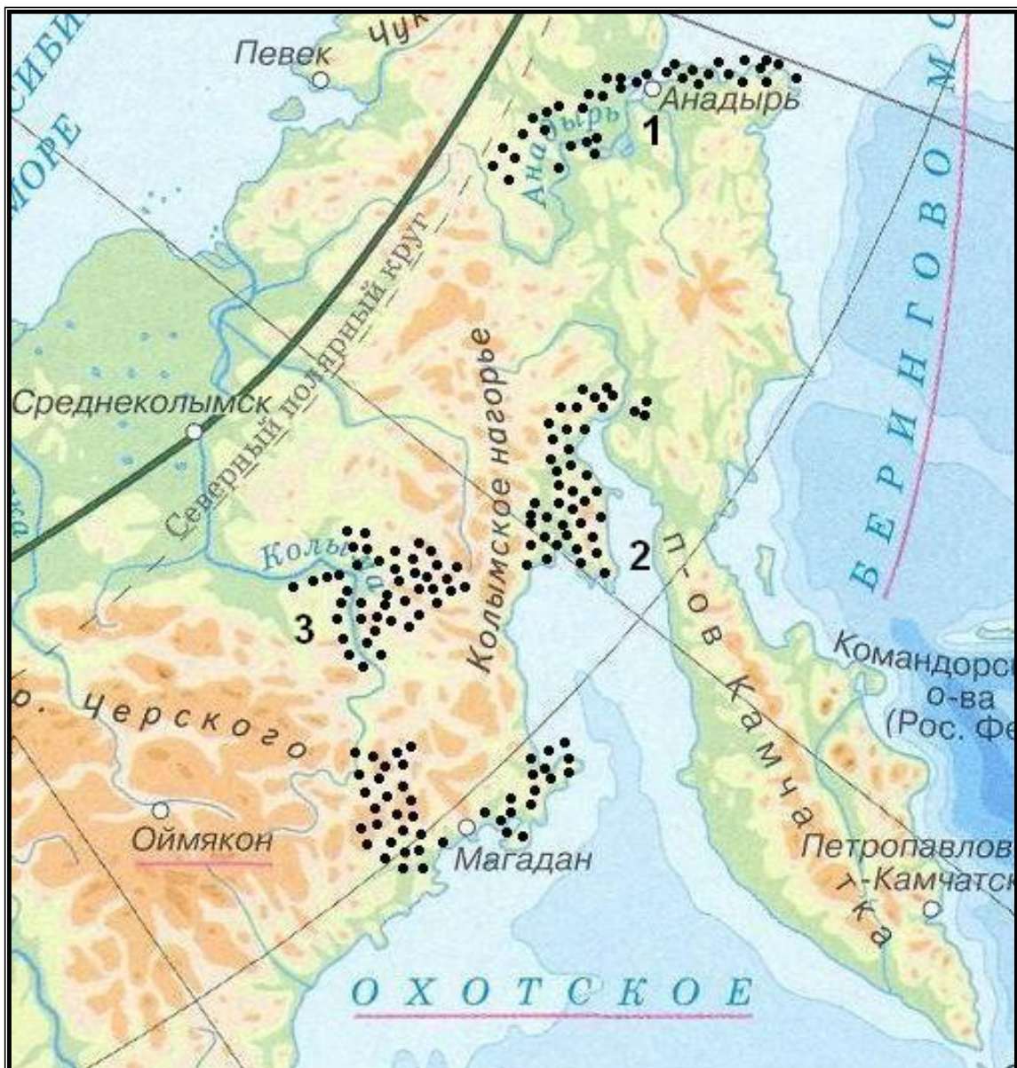
Зоны субстратной и «контактно-указующей» топонимии нейтральной и позитивной окраски

Нагаева (рус.) Субстратные топонимы зачастую изменяются до неузнаваемости, поскольку записывающие их со слов местных жителей не всегда могли точно передать звуковой облик слов эвенского, корякского и других языков, кроме того, некоторые фонетические особенности этих языков не могут быть переданы средствами русского алфавита (см. многие случаи реконструкции субстратных топонимов в Топонимическом словаре Северо-Востока СССР). Например, бытующий ныне гидроним Армань в Лоции Охотского побережья встречается в двух вариантах - Арман и Армань, гидроним Малтан (совр.) на карте 1926 года зафиксирован как Мольтан, то же с гидронимами Сердык - Сердых, Нельканджа - Нелькандя, Челомджа - Чоломджа и др.