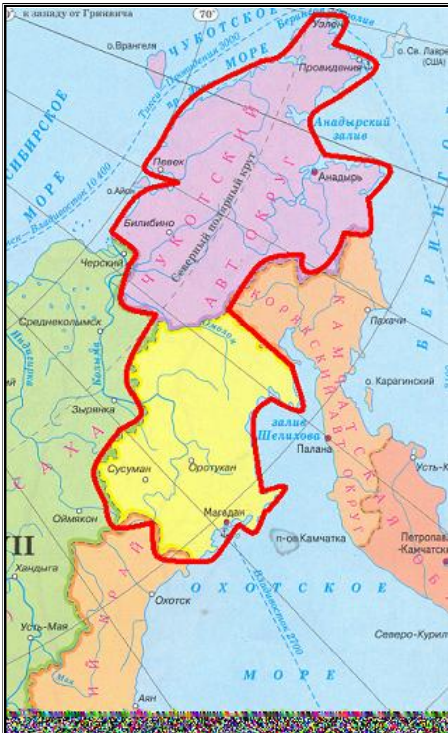
Расположение исследуемого региона на территории Дальнего Востока