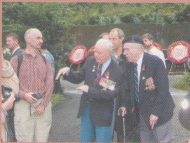
Все, что связано с лагерем Кинкасэки, не вызывает приятных воспоминаний