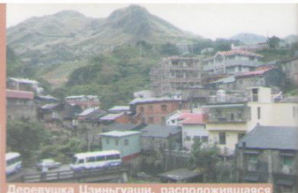
Деревушка Цзиньгуаши, расположившаяся на склонах холма, который дважды в день преодолевали узники поутру, направляясь в шахту, и вечером, возвращаясь в лагерь.

В конце 1942 года сюда было интернировано около 500 военнопленных из 70.000 контингента союзных войск, захваченных японцами во время военной операции в Сингапуре и Ма-