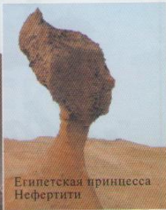
Египетская принцесса Нефертити